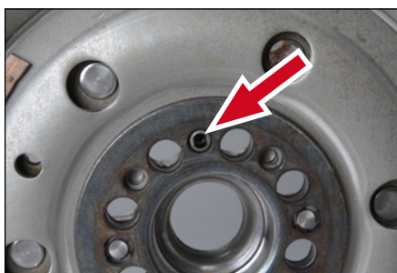
Figuur 2: Tweedelig vliegwiel centreer uitsparing (Krukaszijde).

Deze uitsparing is aangeduid aan de versnellingsbakzijde van het tweedelige vliegwiel aan de hand van een driehoekig merkteken.