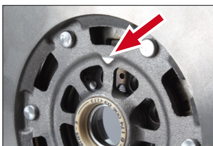
Figuur 3: Driehoekig merkteken aan de versnellingsbakzijde.

U vindt de overeenkomstige wisselstukken in onze online catalogus op www.schaeffler-Aftermarket.com of via RepXpert www.RepXpert.com